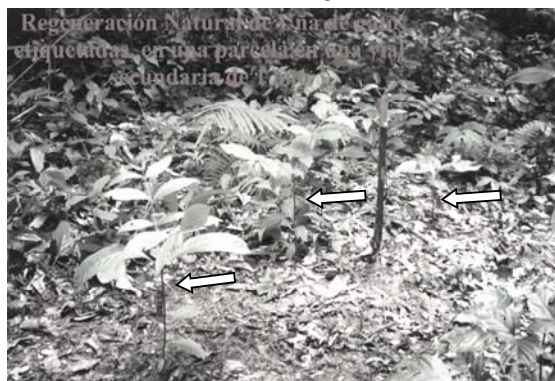
Figura 2. Densidad de la regeneración natural de la Uncaria tomentosa (Will) D.C.

Para evaluar la influencia del factor ambiental luz o iluminación, sobre la regeneración natural de U. tomentosa (Willd.) D.C, se midieron las siguientes características o variables biológicas