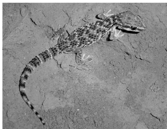
Figura 1. Ejemplar adulto de Phyllodactylus sentosus fotografiado en la Zona Arqueológica de Pachacamac.

establecidos dentro de los sitios arqueológicos, detectando a los animales allí presentes. Cuando la búsqueda nocturna no fue posible, se realizó una búsqueda diurna levantando escombros, sin dañar los restos arqueológicos. Los animales encontrados fueron identificados siguiendo las descripciones dadas por Dixon & Huey (1970). Los lugares de distribución conocidos para P. sentosus , incluyendo los nuevos registros, se muestran en la Figura 2 y se listan, presentando su ubicación y área total aproximada, en la Tabla 1.