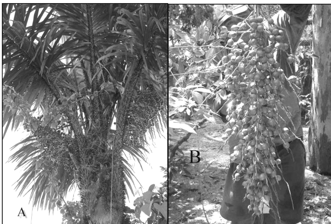
Figura 1. Astrocaryum jauari no ambiente natural. A Detalhe da árvore, B cacho de frutos.

como o impacto de seu extrativismo nas cadeias alimentares desses ambientes.